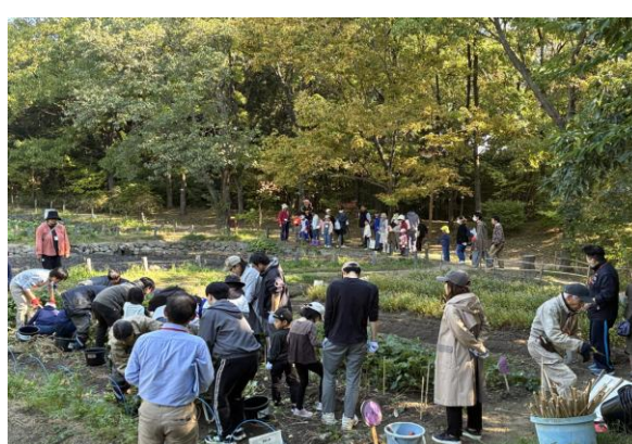
サツマイモ講座(第2回目) 11月8日