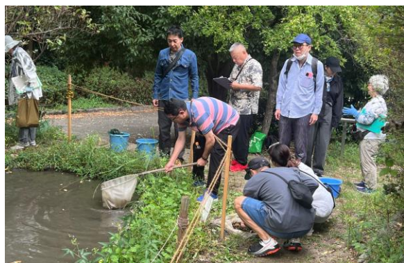
湿地モニタリング調査 10月11日