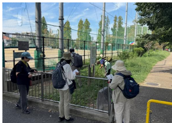
市域生き物調査(長池) 9月28日