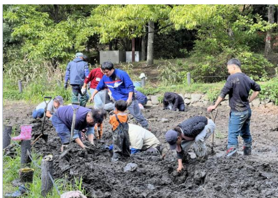
蓮田講座(第2回目) 11月2日