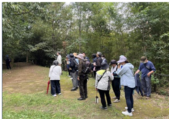
鳥さがし講座(秋)講座(第2回目) 10月25日