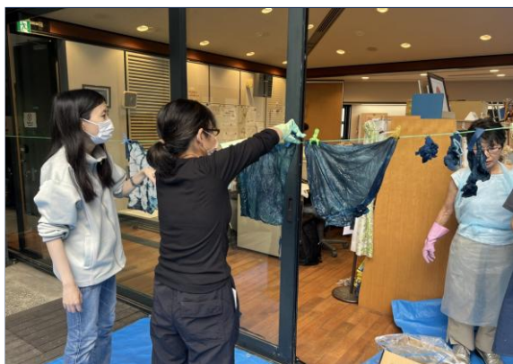
藍講座(第3回目) 10月18日