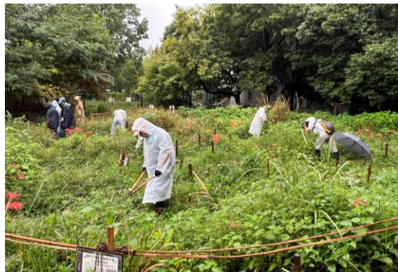
維持管理活動 10月4日