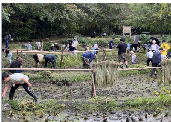
米講座(第5回目) 10月25日