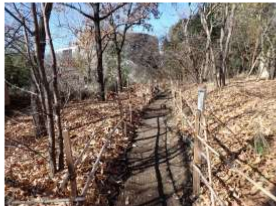
雑木林 250111：竹柵内側の落ち葉はふかふかに