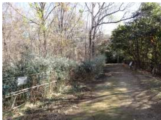
雑木林 250111：竹小枝の上部は切り揃える予定