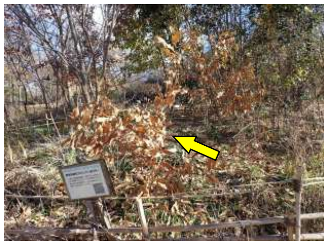
実生林創生ゾーン：クヌギは枯葉をつけたまま