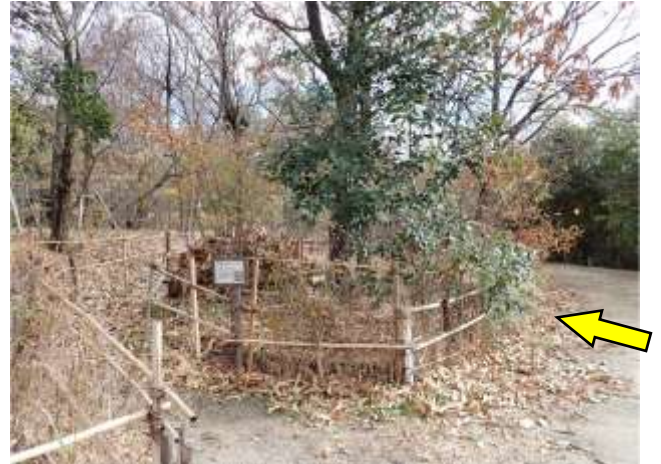
雑木林外周南側は竹枝で落ち葉止めを補修中