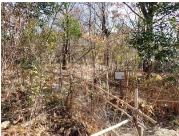
実生林創生ゾーン：かなり見通しがよくなっていた