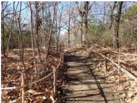
雑木林 250111：りんくう北中さんにより 内部通路の落ち葉はプロワーで集められた