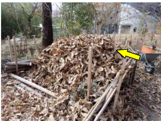
朽ち木ビオトープ：野草広場外周からかき集めた落ち葉