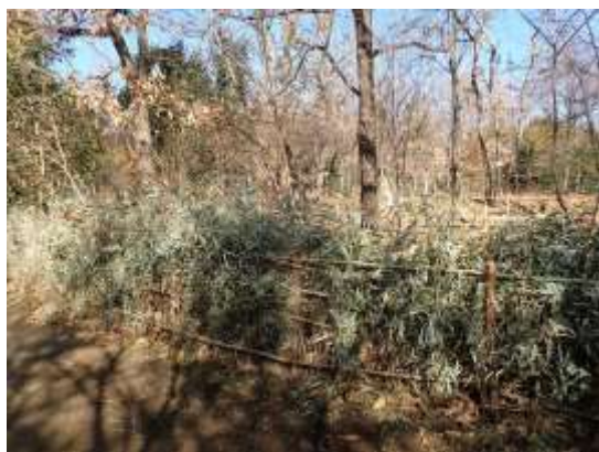
雑木林 250111：外周部分の竹柵には 落ち葉どめの竹の小枝が、さらに挿し込まれた