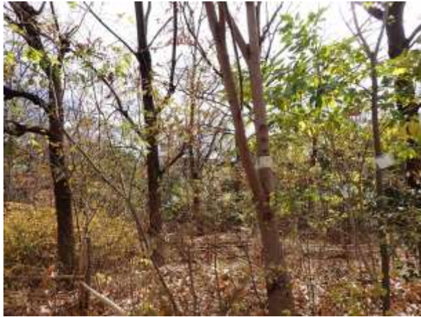
実生林：イヌビワはまだ緑色で黄葉もしていない