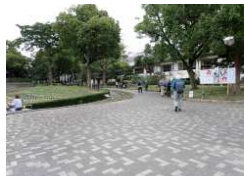
住吉公園 241027