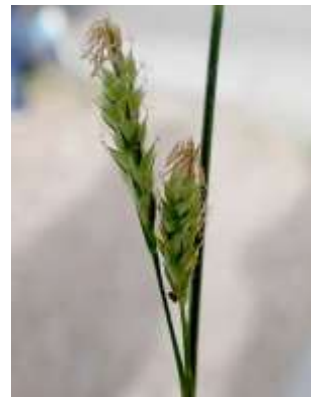
ナキリスゲ 241027