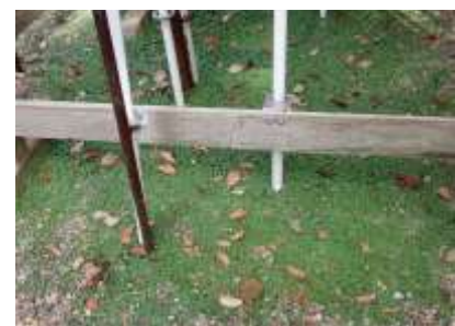
アオイゴケ 241027

・シロアヤヒメノメイガ 4 ・ツツレサセコオロギ 4 ・トビイロシワアリ 4 ・ナカグロクチバ 2,4 ・ハシブトガラス 4 ・ハシボソガラス 4 ・ハスモンヨトウ 2 ・ヒヨドリ 4 ・ヒロヘリアオイラガ 0 羽化後繭 ・マイマイガ 0 繭殻 ・ミズの一種 0 ふん