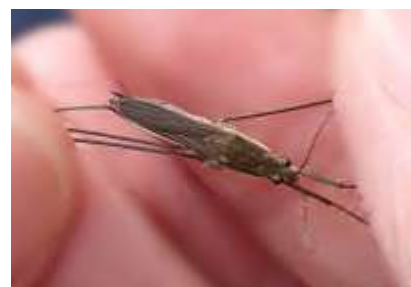
アメンボ 241027

クロガネモチ ● 3 ツククサ 3 ヒメジョオン 1 ヘクソカズラ 1 ムラサキカタバミ 1 メシバ 3 ヤブガラシ 1