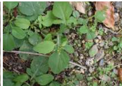
ミチバタガラシ 241027