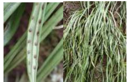
ノキシノブ 241027