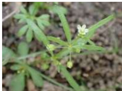
クマバザクロソウ 241027