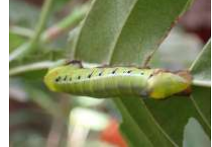
オオスカシバ 241027