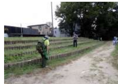
御田周囲 241027