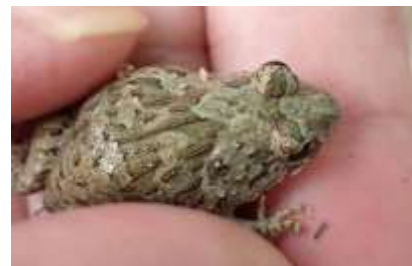
ヌマガエル 241027

オオバタネツケバナ 1 オッタチカタバミ 2,3 オニタビラコ 1 ギシギシ 3 コオニタビラコ 1 コニシキソウ 2,3 スカシタゴボウ 2,3