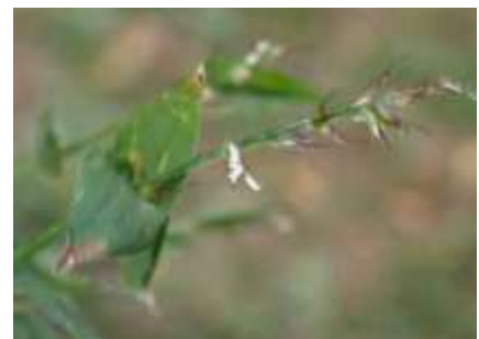
ケチチミザサ 241027