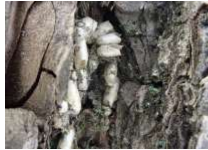
寄生バチの一種の繭殻（マイマイガに） 241027

ナミガタメノキゴケ 1 ニワホコリ 3 ノキシノブ 1 ノゲシ 2 ハイゴケ 1 ハナカタバミ●2 ヒナハイゴケ 1,2 ヒメアカヤスデゴケ 1 ヒメジョオン 2,3 ヒメムカシヨモギ 1 ヘクソカズラ 1 ヘリトリゴケ 1 ホトケノザ 1 ホナガイヌビユ 2,3 マメグンバイナズナ 3 ムカデコゴケ 1 メシバ 2,3 メリケントキンソウ 1 モエギトリハダゴケ 1 ヤブガラシ 1 レブラゴケ属の一種 1 ロウソクゴケ 1