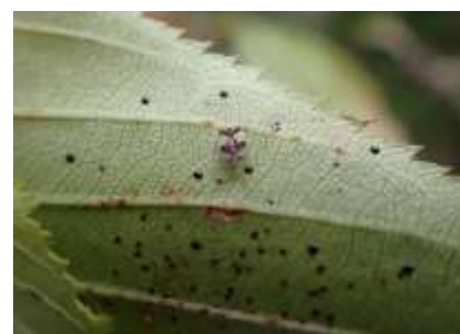
ナシガンバイ 241027