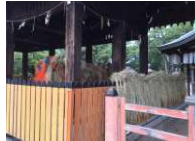
御田のイネが干されていた 241027

コニシキソウ 2 コムカンソウ 3 コメシバ 2 ツククサ 2,3 ムラサキカタバミ 1 外来タンポポの一種 2