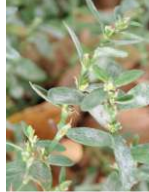
ミチヤナギ 241027

カタバミ 2 キンモクセイ●2 クサイ 3 コメヒシバ 3 シマスズメノヒエ 2,3 シロツメクサ 2 スベリヒユ 1 セイタカアワダチソウ 2 センダン 4 タチスズメノヒエ 1 タマザキフタバムグラ 2,3 ツユクサ 2,3 ネズミノオ 3 ハナカタバミ●2 ハマスゲ 3 ヒルガオ属の一種 1 ホトケノザ 1 ホナガイヌビユ 2,3 マメグンバイナズナ 2,3 ミチヤナギ 2 ムラサキカタバミ 1 メヒシバ 2,3 メリケンキンソウ 1 ヤブガラシ 1 ヨモギ 1 外来タンポポの一種 2