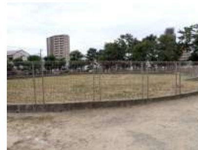
御田：稲刈り後の姿 241027

・ハシボソガラス 4 ・ヒメアシダカグモ 4 ・ヒメナガカメムシ属の一種 4 ・ヒヨドリ 0 声 ・ヒロズミノガ 0 繭殻 ・ヒロヘリアオイラガ 0 羽化後繭 ・ホソヒラタアブ 4 ・マイマイガ 2 死体,0 繭殻 ・マダラバッタ 4 ・マツカレハ 3 ・ヤマトシジミ 4 ・寄生バチの一種(マイマイガに)0 繭殻 アオギヌゴケ 1 アメリカタカサブロウ 2,3 アメリカフウロ 1 アレチギシギシ 1 イヌビワ 4 イヌホオズキ 2,3 ウラジロチチコグサ 1 ウロコレブラゴケ 1 エノキグサ 3 エノクログサ 2,3 オオアレチノギク 1 オオキバナカタバミ 1