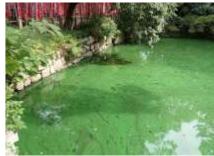
石舞台の池：絵の具のような鮮やかな 緑色はアオコ（ラン藻）の発生か 241027

アメリカタカサブロウ 2,3 アレチノギク 2,3 イヌホオズキ 2,3 ウラジロチチコグサ 1 エノキ 3 エノキグサ 3 エノコログサ 3 オシロイバナ 2 オッタチカタバミ 1 オニタビラコ 2 オヒシバ 3 カタバミ 2