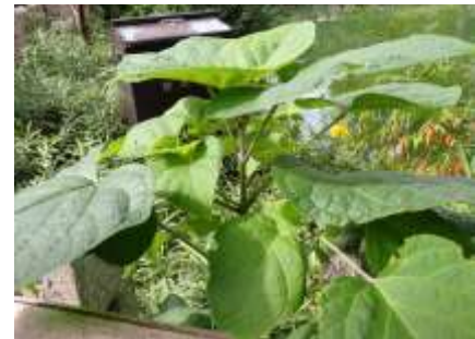
クサギ 241027 撮影 柗元慶子