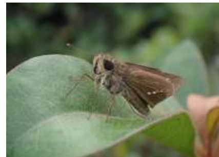
イチモンジセセリ 241027