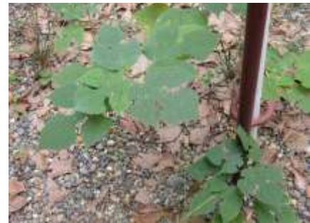
カジノキ 241027