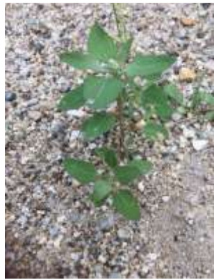
シロザ 241027

ナミガタメノキゴケ 1 ニワホコリ 3 ノキシノブ 1 ノゲシ 2 ハイゴケ 1 ハナカタバミ●2 ヒナハイゴケ 1,2 ヒメアカヤスデゴケ 1 ヒメジョオン 2,3 ヒメムカシヨモギ 1 ヘクソカズラ 1 ヘリトリゴケ 1 ホトケノザ 1 ホナガイヌビユ 2,3 マメグンバイナズナ 3 ムカデコゴケ 1 メシバ 2,3 メリケントキンソウ 1 モエギトリハダゴケ 1 ヤブガラシ 1 レブラゴケ属の一種 1 ロウソクゴケ 1