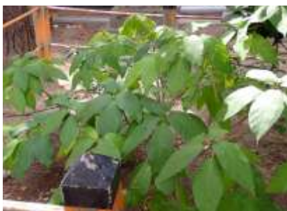
イヌビウ 241027