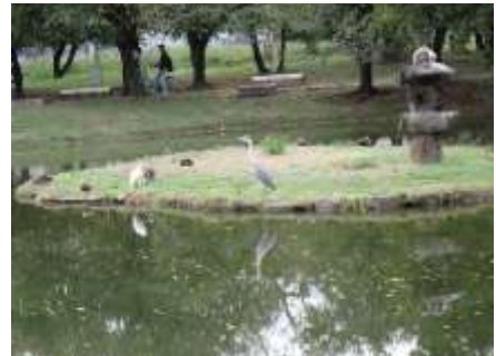
心字池の島にアオサギ、コサギ、カルガモが集まっていた 241027

シロツメクサ 2 ゼニアオイ属の一種 1 セリ 1 ダイダイゴケ科の一種 1 タチスズメノヒエ 2 ツククサ 2,3 トキワハゼ 1 ヒガンバナ 2 ヒナタイノコヅチ 3 ヒメムカシヨモギ 2,3 ホソバツルノゲイトウ 2 マメグンバイナズナ 2,3 マルバツユクサ 3 ミチヤナギ 2 メリケンガヤツリ 2,3 ヨモギ 1