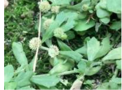
トキンソウ 241027