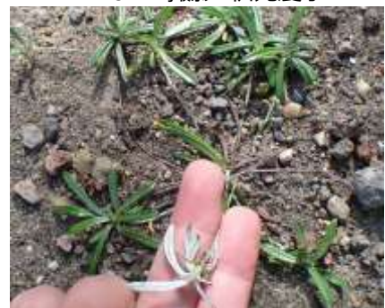
チチコグサ 241027