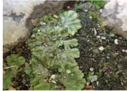
コハタケゴケ 241027