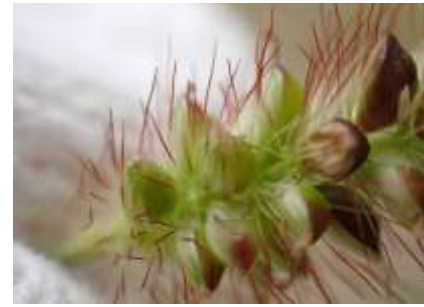
キンエノコ 241027

ヒガンバナ 1 ヒメジョオン 2,3 ホソバナチチコグサモドキ 3 ホトケノザ 3 マメグンバイナズナ 3 マルバツユクサ 2 メヒシバ 3 メリケントキンソウ 1 ヤハズエンドウ 1 ヤブガラシ 1 ヨウシュヤマゴボウ 1 ワルナスビ 1 外来タンポポの一種 2