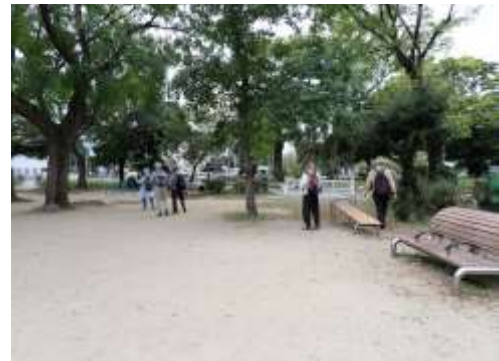
住吉公園 241027

ヘクソカズラ 1 ホトケノザ 1 ホナガイヌビユ 2 マルバツユクサ 1 ムクロジ●3 ムラサキカタバミ 1 メヒシバ 3 メリケンガヤツリ 2 メリケントキンソウ 1 ヤハズエンドウ 1 ヤブガラシ 1 ヨモギ 1 外来タンポポの一種 2,3