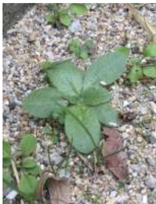
ツボミオオバコ 241027

オオバコ 1 オッタチカタバミ 2 オヒシバ 2,3 カタバミ 1 ギシギシ 3 キウリグサ 1 クグヤツリ 2,3 クルマバザクロソウ 2,3 ケカガミゴケ 1 コガネゴケ 1 コニシキソウ 2,3 コフキチリナリア 1 コミカンソウ 3 コメシバ 3 サヤゴケ 1,2,3 シロザ 1 スカシタゴボウ 1 スベリヒユ 2,3 セイバンモロコシ 2 ダイダイゴケ科の一種 1 チチコグサモドキ 1 ツボミオオバコ 1 ツメクサ属の一種 2,3