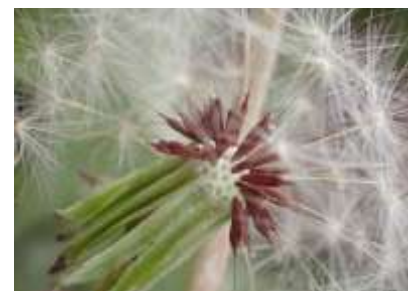
アカミタンポポ 241027