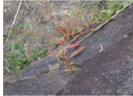
チョウジタデ 241027

ホソバヒメミソハギ 3 ホナガイヌビユ 2,3 ムラサキカタバミ 1 メシバ 3