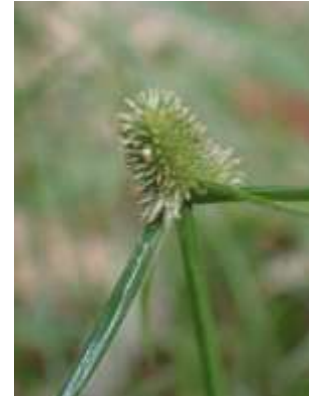
アイダクグ 241027