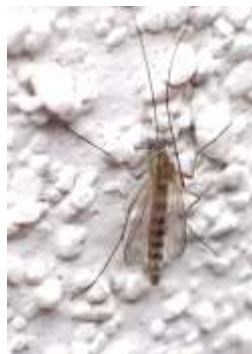
ユスリカ科の一種 240324