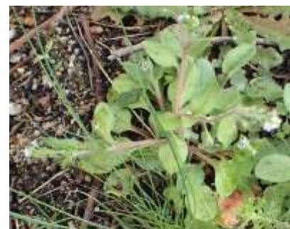
キュウリグサ 240324