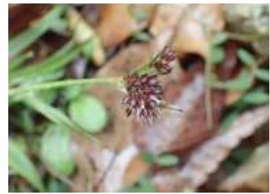
スズメノヤリ 240324