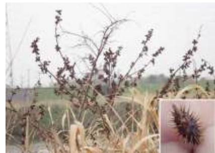
オオオナモミ 枯れた実をつけた枝が 上に広がり、ところどころで株が目立つ 240324