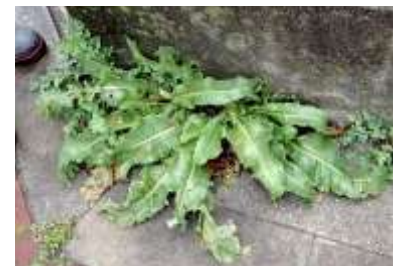
ナガバギシギシ (中央) と ナガミヒナゲシ (左上) 240324

セイタカアワダチソウ 1 ダイダイゴケ科の一種 1 タンポポ属の一種 1 ナガバギシギシ 1 ナガミヒナゲシ 1 ノボロギク 2,3 フラサバソウ 2 ヘラオオバコ 1 ホトケノザ 1 マメゲンバイナズナ 2 ヤエムグラ 1 ヤハズエンドウ 2 ヤブジラミ 1 ヨモギ 1