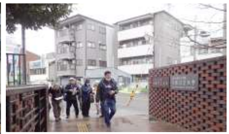
大阪公立大学杉本キャンパス 北西紋から南部ストリートへ 240324