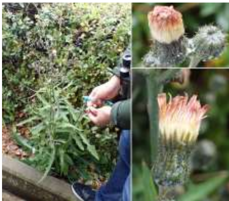
タイワンハチジョウナ 巨大なノゲシに見える 240324