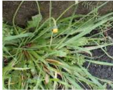
ブタナ 歩道の間隙から 240324

コハコベ 1 コマツヨイグサ 1 コメツブツメクサ 2 スズメノエンドウ 2 スズメノカタビラ 2 タンポポ属の一種 1 ツメクサ属の一種 2 ナガミヒナゲシ 1 ノゲシ 1 ヒメジョオン 1 ブタナ 2 ヘラオオバコ 1 ホソムギ 2 ホトケノザ 1 ミチタネツケバナ 2,3 ヤエムグラ 1 ヤハズエンドウ 2