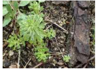
キヌゲチチコグサ 240324

ヒメジョオン 1 ヘラオオバコ 1 ホトケノザ 2 マメカミツレ 2 マメガンバイナズナ 2,3 マンネングサ属の一種 1 ミゾイチゴツナギ 2,3 ミチタネツクバナ 2,3 ムカデゴケ 1 ムラサキカタバミ 1 メリケンカルカヤ 3 メリケントキンソウ 1 ヤエムグラ 2 ヤハズエンドウ 2 ヤブジラミ 1 ヤブタバコ 1 ヨモギ 1 レブラゴケ属の一種 1 外来タンポポの一種 2,3