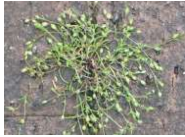
ツメクサ属の一種 240324