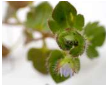
フラサバソウ 240324