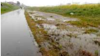
カラシナの黄色い花が続く 本種も一帯を覆うほど繁茂していた 240324