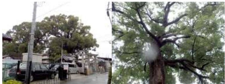
阿麻美許曾神社 境内は掃き清められて野草は少なかった