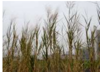
セイトカヨシ ヨシ原は広くないが 西中島周辺（淀川右岸）よりも本種が多く見 られた 240324