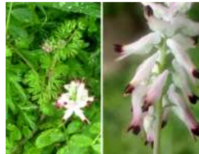
ニセカラクサケマン 最近見られるようになった外来種 240324