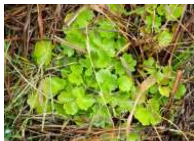
タガラシ 芽生えたばかり 240324