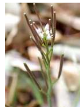
ミチタネツクバナ 240324