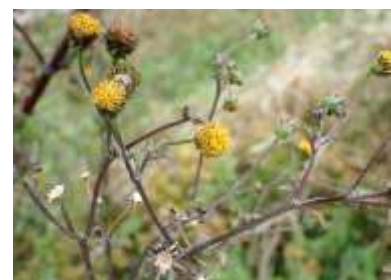
コセンダングサ 240324