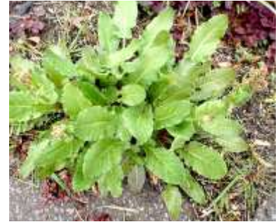
スイバ 240324