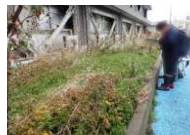
理学部棟の南側は野草満載 240324