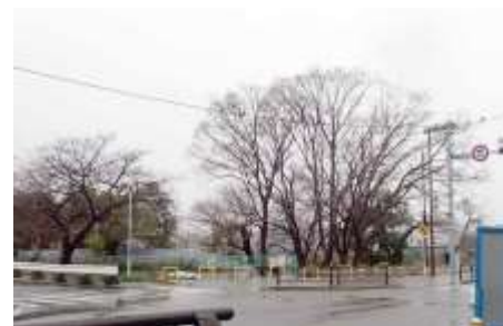
下高野橋北詰のエノキの大木