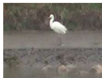
ダイサギ 対岸の水際にいた 240324