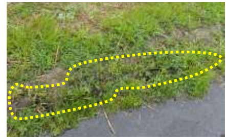
モグラ属の坑道 発見したのは上田諒太 240324