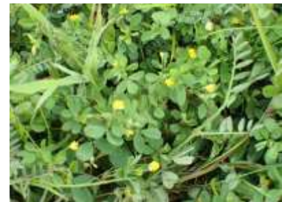
コメツブツメクサ 240324