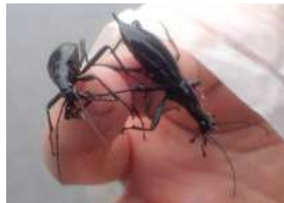
マイマイカブリ オス 2 匹 (捕獲 上田諒太) 240324