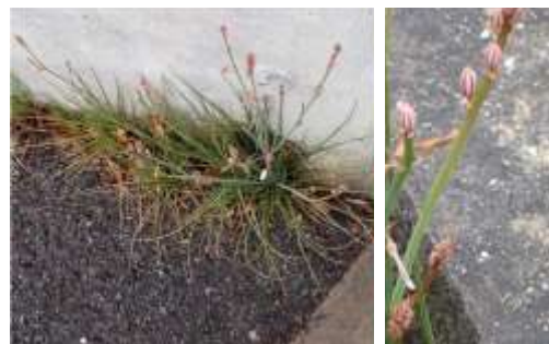
ハナツルボラン 中西有美同定 240324

セイバンモロコシ 3 タンポポ属の一種 1 ツメクサ属の一種 2 ナガバギシギシ 1 ナヨクサフジ 2 ハナツルボラン 2 ヒメオドリコソウ 2 ヒメジョオン 1 ヘラオオバコ 2