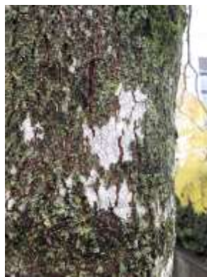
ジャガランタ幹に、モジゴケ属、 ナミムカデゴケ、ムカデゴケ、 ロウソクゴケが着生 240324