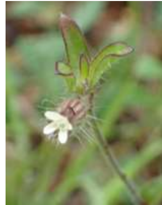
マンテマ属の一種 240324

ヘラオオバコ 1 ホトケノザ 1 マンテマ属の一種 2 ミチタネツケバナ 2,3 ヤエムグラ 1 ヨモギ 1 外来タンポポの一種 2