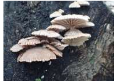
スエヒロタケ 240324