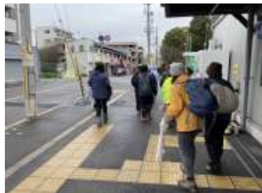
杉本町駅出発 240324