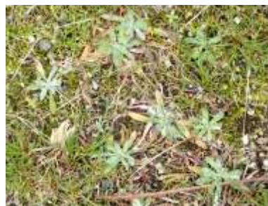
チチコグサ 240324