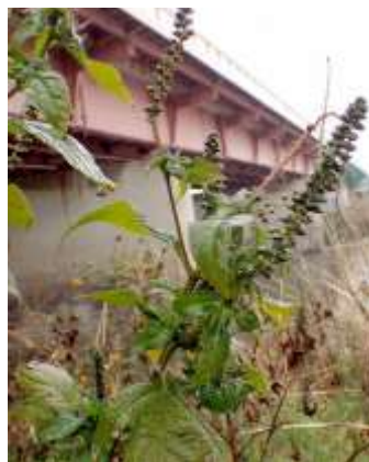
特定外来生物 オオブタクサ 2020年に瓜破東(上流)の河川 敷で大繁茂しているのを見つけたが、こ の一帯にも分布している 240324