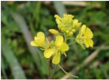
カラシナ 全域で咲いていた 240324