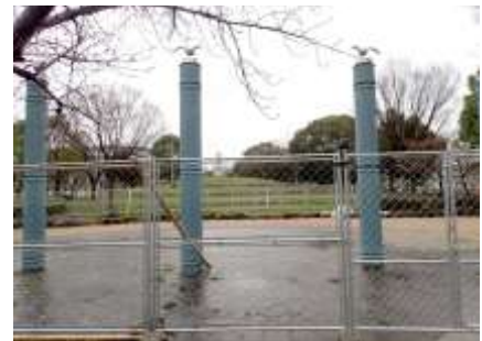
浅香中央公園 240324

シロツメクサ 2 スズメノカタビラ 3 ノボロギク 2 ヘラオオバコ 1 ホトケノザ 2 マメ科の一種 2 メリケントキンソウ 1 ヤハズエンドウ 1 ヨモギ 1