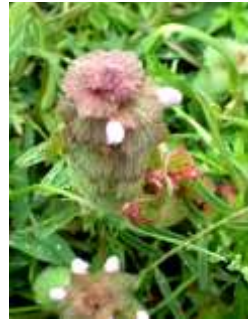
ヒメオドリコソウ 240324