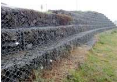
吾彦大橋東側の護岸 箱型の金属網に石を入れた「フトンかご」が 並んでいた 240324 撮影 柗元慶子