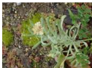
セイタカハハコグサ 240324