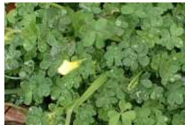
オオキバナカタバミ 240324