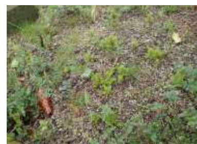
キヌゲチチコグサなど植え込みの野草