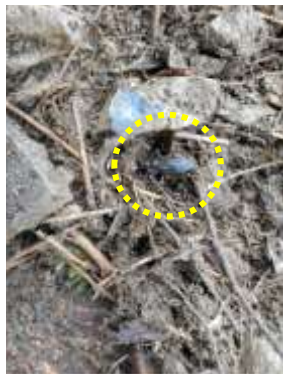
マイマイカブリの越冬環境と見つかった個体 240324