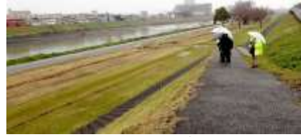
大和川西公園 きつく刈り込まれている 240324