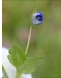
オオイヌノフグリ 雨でつぼんでいた 240324