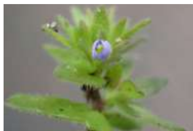
タチイヌノフグリ 240324