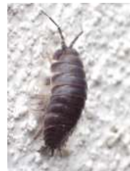
ワラジムシの一種 240324