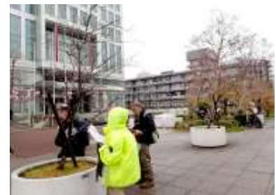
学術情報センターの東側 240324