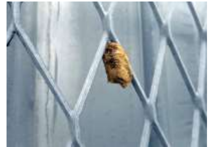
チョウセンカマキリの卵鞘 240324