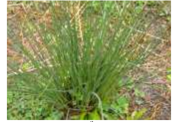
イグサ 240324