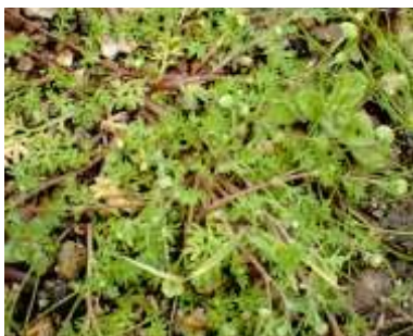
マメカミツレ 240324