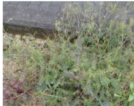
歩道横の植え込みにノゲシ、スズメノエンドウ 240324