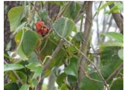
タンキリマメ 240324