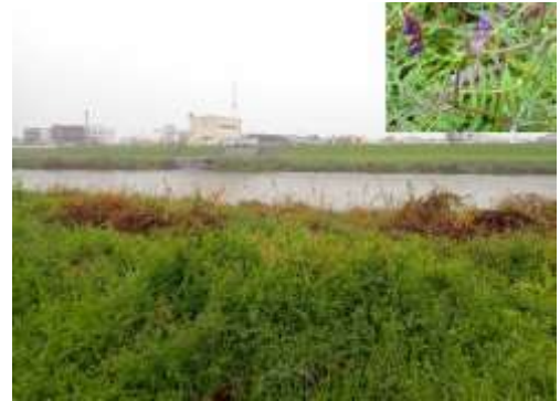
ナヨクサフジ 一帯を覆いつくしていた 今回のルートの大和川右岸全域に繁茂している 240324