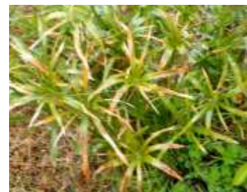
シュロガヤツリ 1 株だけだった 240324