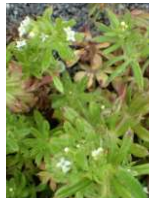
ヤエムグラの花は目立たない 240324

スズメノエンドウ 2 ナヨクサフジ 2 ハナツルボラン 2 ヘラオオバコ 1 ホトケノザ 2 マンテマ属の一種 2 ヤエムグラ 1 ヤハズエンドウ 1 ヨモギ 1