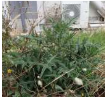
アメリカオニアザミ 花もあつた 240324

チチコグサモドキ 2 トウジュロ 4 ナガミヒナゲシ 1 ノゲシ 2,3 ノボロギク 2 ヒメオドリコソウ 2 ヒメジョオン 1 ヒメツルソバ 2,3 ヒメリュウキンカ●2 ヒルザキツキミソウ 1 フラサバソウ 2,3 ホトケノザ 2 ミチタネツケバナ 1 メリケンカルカヤ 3 モジゴケ属の一種 1 ヤエムグラ 1 ヤハズエンドウ 2 ヤブジラミ 1 ヨモギ 1 ロウソクゴケ 1 外来タンポポの一種 2