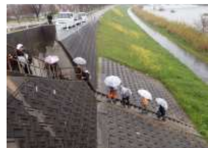
行基大橋北詰から大和川を渡る 240324