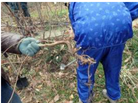
抜けたアキニレの根：この大きさでもかなり時間がかかった