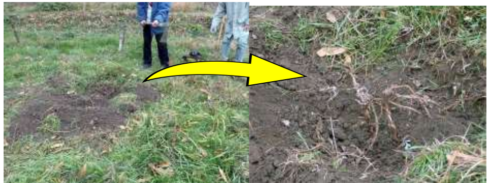
実生樹木の根を掘り進めると巨大な穴になった。 複雑に曲がりくねった根はまだ抜けない