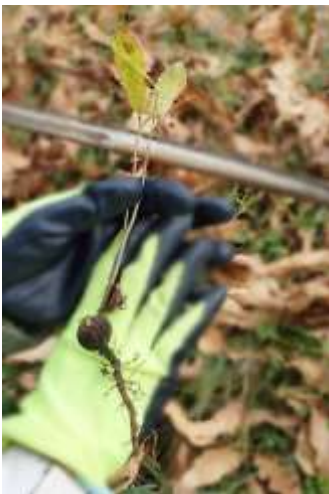
クヌギ実生、1年目か