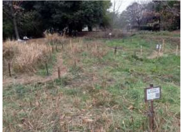
作業後：落葉も整理し下から緑が出ている