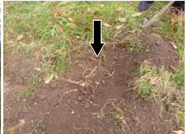
20240106_制限時間の30分でやっと元の根にたどり着いた。切った跡や四方へ広がる根が見える。