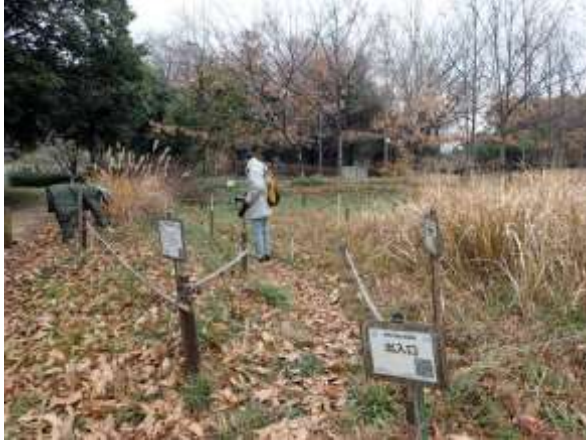
作業前：冬枯れの様子