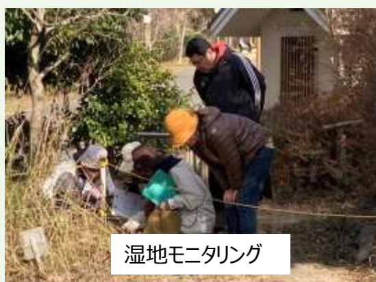
湿地モニタリング