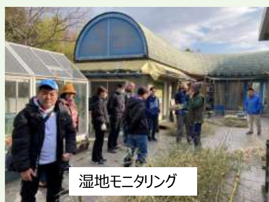
湿地モニタリング