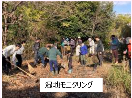
湿地モニタリング