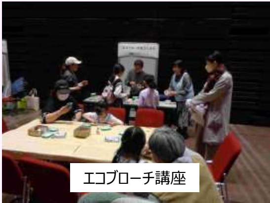
エコアプローチ講座