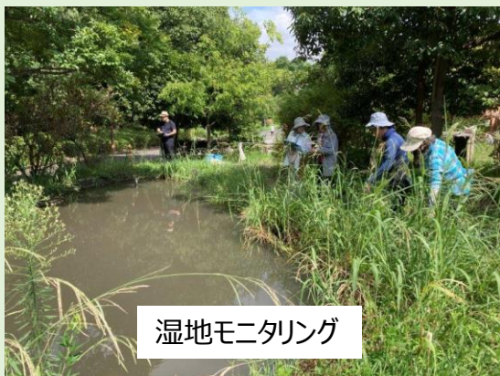
湿地モニタリング