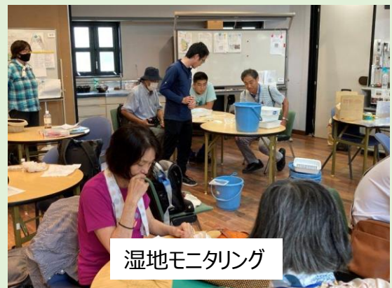
湿地モニタリング