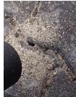
クロヤマアリの巣 230827