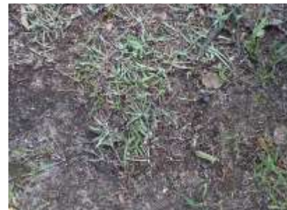
チチコグサ 230827