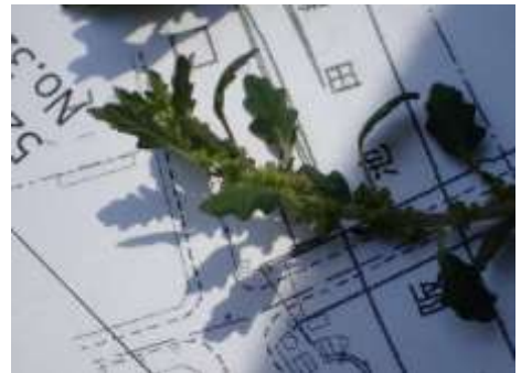
ゴウシュウアリタソウ 230827