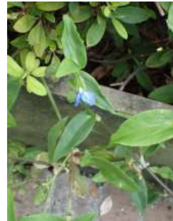
ツユクサ 230827

キュウリグサ 2,3 クスノキ ●1 クワクサ 2,3 シャリンバイ ●3 チチコグサモドキ 2,3 ツユクサ 2 ツブキ ●1 ノゲシ 2,3 ヒメムカシヨモギ 2 ヘクソカズラ 1 ムクノキ 4 メヒシバ 2,3 ヤブガラシ 1 ヤブラン 2 外来タンポポの一種 2