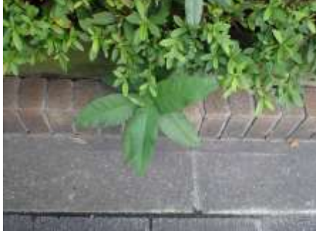
イヌビワ 230827