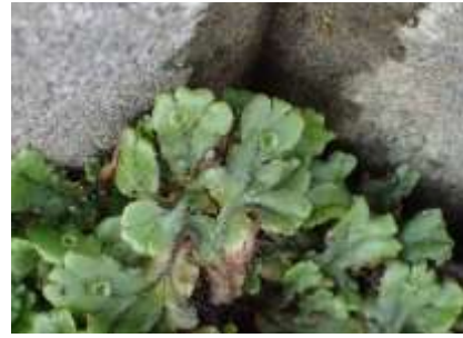
ゼニゴケ 230827

タネツケバナ 2,3 チガヤ 1 ツユクサ 2,3 テリミノイヌホオズキ 3 ドクダミ 1 ナガエコミカンソウ 2,3 ヒナタイノコヅチ 1 ヒメジョオン 1 ヒメムカシヨモギ 2 ムラサキカタバミ 1 メヒシバ 2,3 ヤブガラシ 1 ヨモギ 1 外来タンポポの一種 2