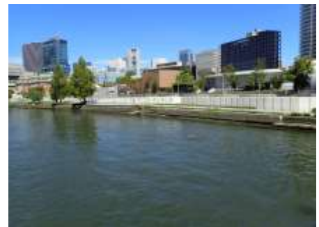
難波橋より堂島川 230827