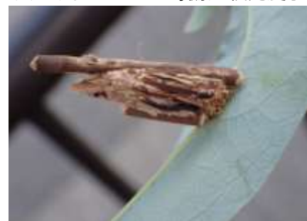
チャミノガ 230827