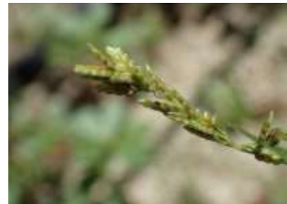
コゴメガヤツリ 230827