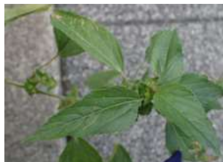
エノキグサ 230827