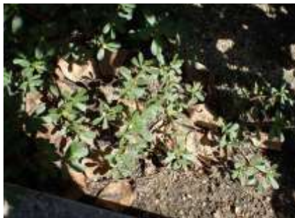
スベリヒユ 230827