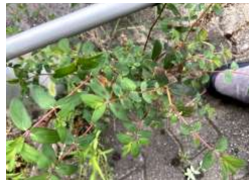
オオニシキソウ 230827