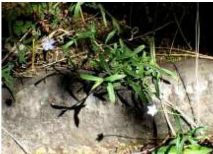
ヒナギキョウ 230827