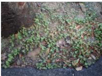
アオイゴケ 230827