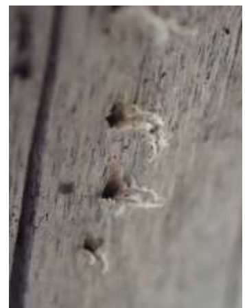
クマゼミ産卵痕 230827