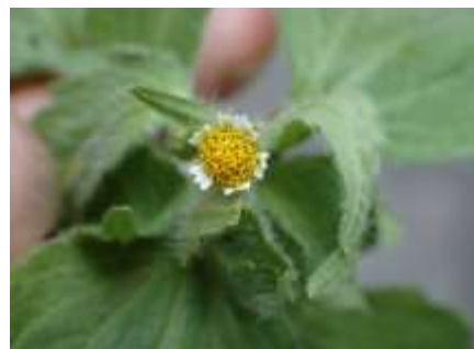
ハキダメギク 230827