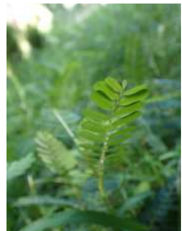
コミカンソウ 230827