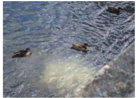
雑種ガモ(アイガモ?) 230827 撮影 柘元慶子

タネツケバナ 3 チチコグサ 1 ツユクサ 2,3 ナガエコミカンソウ 2,3 ニワホコリ 3 ノウゼンカズラ ●2 ノゲシ 2,3 ハキダメギク 2 ヒナギキョウ 2 ヒメコバンソウ 3 ヒメジョオン 1 ヒメムカシヨモギ 2,3 ヒルガオ属の一種 1 ヒロハホウキギク 2,3 ヘクソカズラ 1 ホナガイヌビユ 2 マメグンバイナズナ 2,3 ムラサキカタバミ 1 メヒシバ 2,3 メリケンガヤツリ 3 メリケンカルカヤ 3 ヤブガラシ 1 ヨウシュヤマゴボウ 2,3 ヨモギ 2 外来タンポポの一種 1