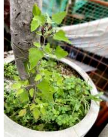
シロザ 230827 撮影 林耕太

チチコグサモドキ 1 ナガエコミカンソウ 3 ヒメジョオン 2 ヒメムカシヨモギ 2,3 ヘクソカズラ 1 マメガンバイナズナ 3 ヨウシュヤマゴボウ 2 ヨモギ 1