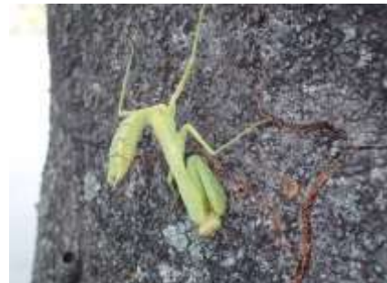
ハラビロカマキリ 230827