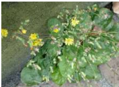
オニタビラコ 230827