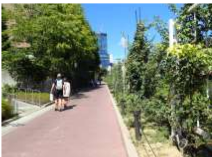
中之島公園 230827