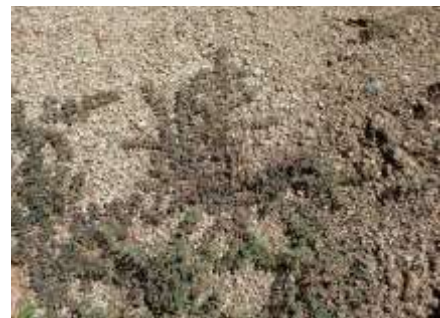
コシキソウ 230827