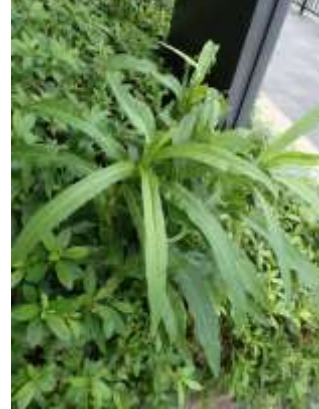
アキノノゲシ 230827