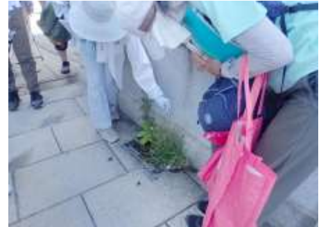
難波橋南詰で隙間の植物を記録 230827