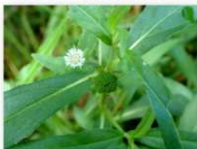
アメリカカタサブロウ 20230812