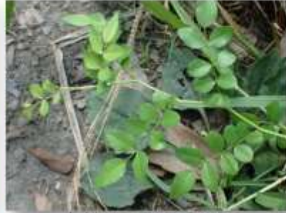
トゲナシデリハノイバラ 20230812