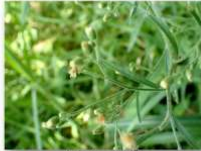
オオアレチノギク 20230812