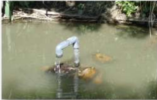
雨が降らず常時給水 バルブは全開放 粗朶のところまで水位保つ 20230805