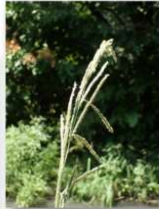
タチスズメノヒエ 20230812