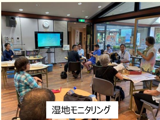
湿地モニタリング