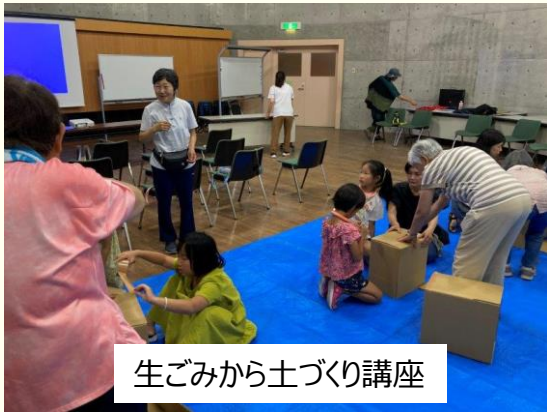
生ごみから土づくり講座