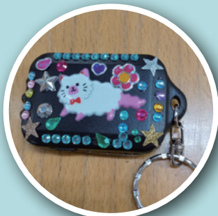
リアルにブルーアースおおさか