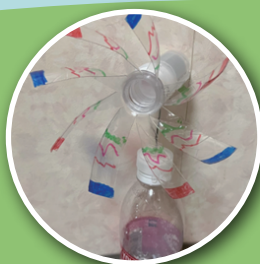
大阪環境カウンセラー協会