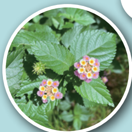
大阪自然環境保全協会