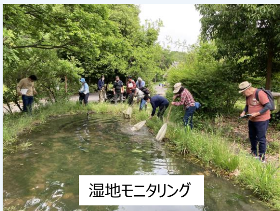
湿地モニタリング