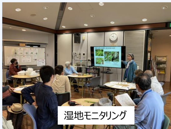
湿地モニタリング