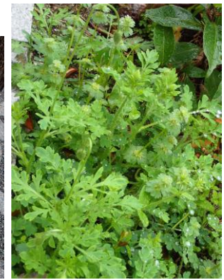
ナガミヒナゲシ 230326