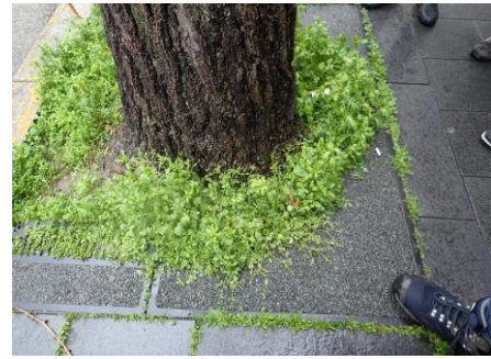
コハコベやナズナなど群生する植樹樹 東京海上前 230326