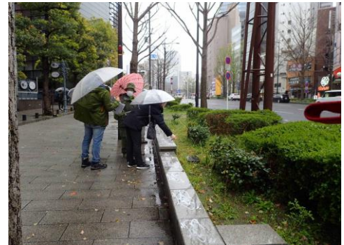
フェニックスタワー前 230326