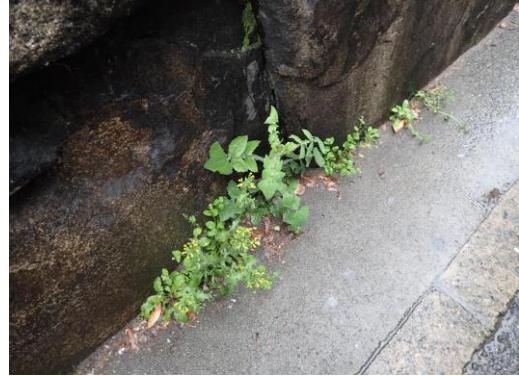
ノボロギクやノゲシ、キュウリグサなど混生 南御堂石垣の隙間