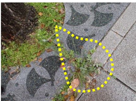
ブタナ 住友生命前 230326