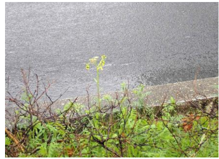
ノボロギク 230326