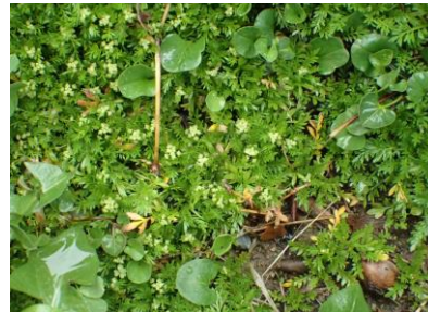
カラクサナズナとアオイゴケ 230326