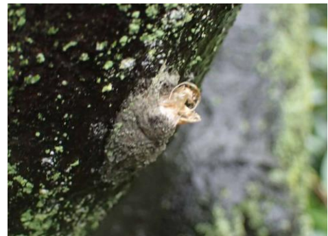
ヒロヘリアオイラガの羽化後繭 坐摩神社 230326

センニンソウ 1 ソメイヨシノ ● 2 ツバキ属の一種 ● 2 ノゲシ 1 ヒメムカシヨモギ 3 ミツマタ ● 2 ムラサキカタバミ 1 ヤブツバキ ● 2 レンギョウ ● 2