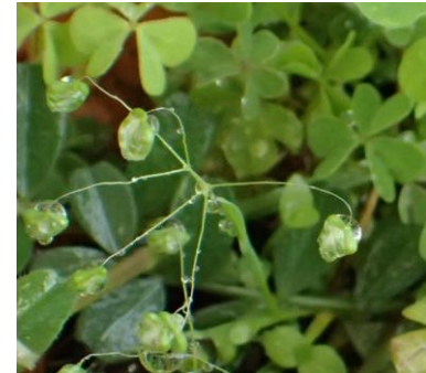
ヒメコバンソウ 230326