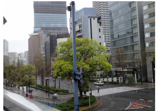
梅新交差点南側 230326