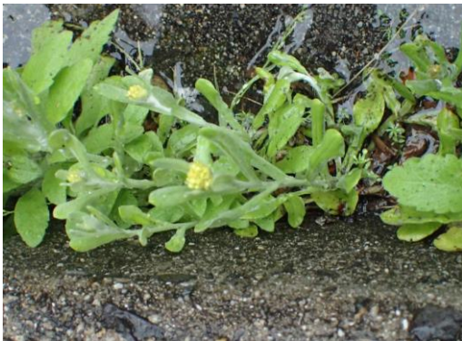
ハハコグサ と判断 230326