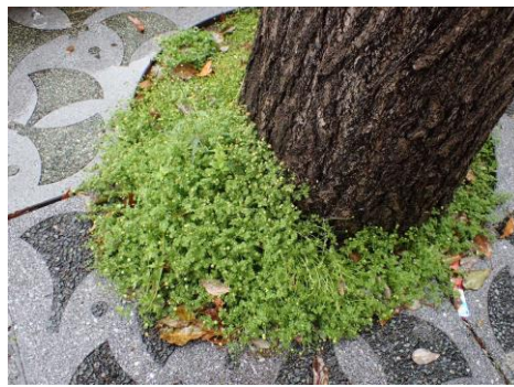
マメカミツレ群生植樹柵 住友生命前 230326