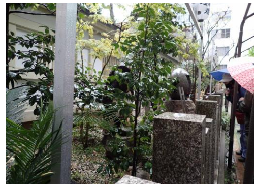
露天神社境内 230326