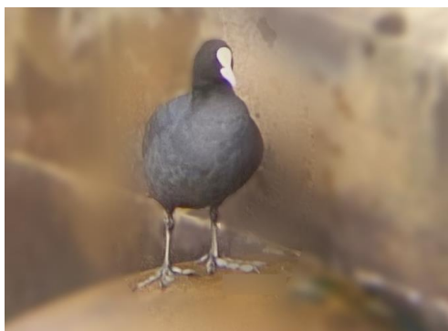
オオバン_大江橋たもと 230326