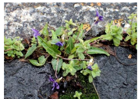
ヒメスミレ 230326