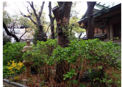
坐摩神社 230326

ツタバウンラン 2 ツメクサ属の一種 1 ナズナ 2,3 ノゲシ 2 ノミノツヅリ 1 ハハコグサ 2 ハルジオン 2 ヒナキキョウソウ 2 ホトケノザ 2 マメカミツレ 2 ミドリハコベ 2 ムラサキカタバミ 1 外来タンポポの一種 2