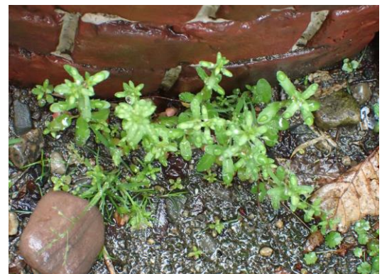
ムシクサ 露天神社境内 230326