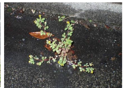
コメツツメクサ 230326