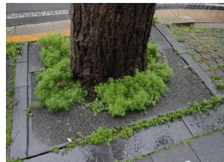
ヤエムグラ群生植樹樹 東京海上前 230326