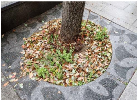
イチョウ植樹柵 このような草が少ない柵はまれ フェニックスタワー前 230326