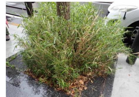
タケ亜科の一種 (ササのなかま) 群生植樹樹 野村不動産御堂筋ビル前 230326