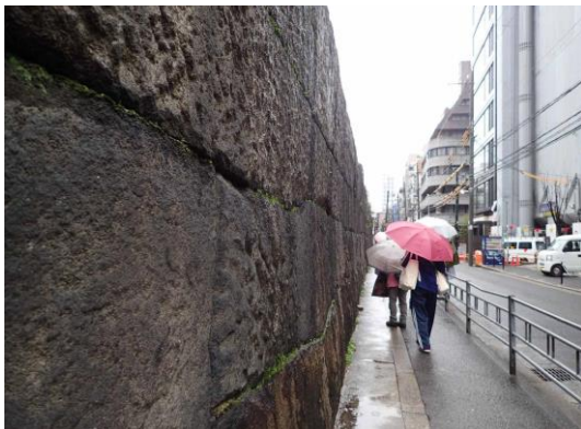
南御堂西石垣 230326