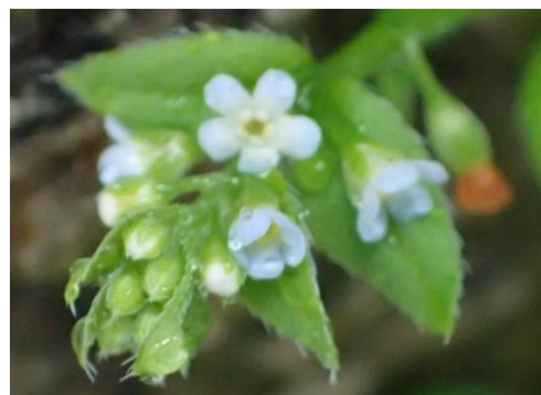
キュウリグサ南御堂西 230326

カタバミ 2 カタバミ属の一種 1 カニコサ 2 キュウリグサ 2 コハコベ 1 コメツブツメクサ 2 スズメノエンドウ 2 スズメノカタビラ 2 セイタカハハコグサ 2