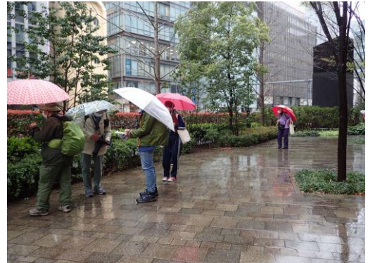
阪神百貨店東側：3年前は整備したばかりだった 今はもう植栽は安定しているとみられる 230326