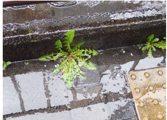
タンポポ属の一種 230326