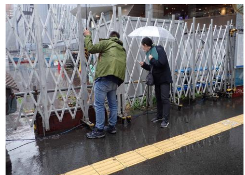
大阪駅前工事中エリアにも野草がみられた 230326

・ヒヨドリ 4 タネツケバナ 2,3 ウラジロチチコグサ 2,3 チチコグサモドキ 1 カタバミ 1 ムラサキカタバミ 1 スズメノカタビラ 2 ヨモギ 1