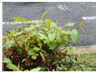
イタドリ 230326