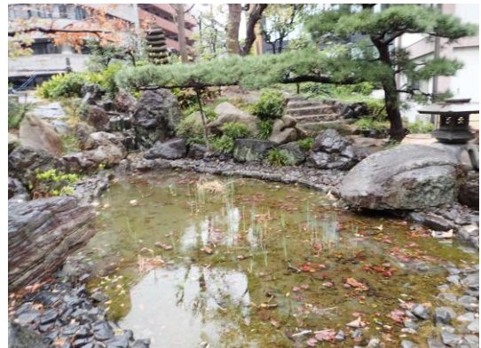
南御堂境内内庭園 230326