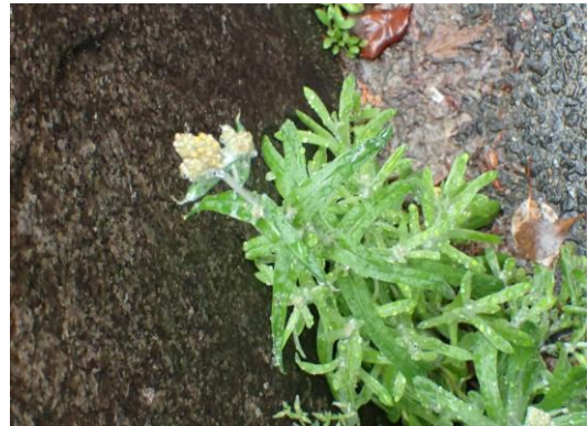
セイタカハハコグサ と判断 230326