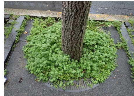
アメリカフウロ群生植樹樹 大阪ガス御堂筋東ビル前 230326