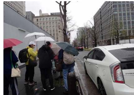
淀屋橋南詰 230326