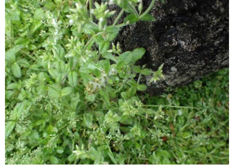
オランダミミナグサとホソバナチチコグサモドキ 備後町 230326

ムラサキカタバミ 1 ヤエムグラ 2 ヤハズエンドウ 2 外来タンポポの一種 2,3