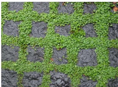
ノチドメでメッシュになっている 歩道ブロック 230326