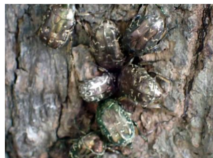
シロテンハナムグリが、ナラガシワの樹液をなめ きていた(樹液酒場) 210718