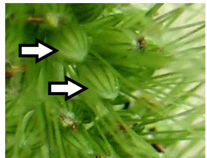
エノコログサ：第2苞穎が先まで覆う 210718