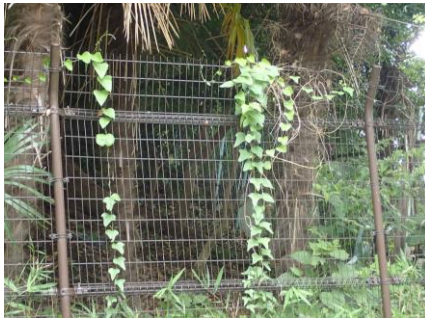
アオツヅラフジがフェンスに巻き付いていた 210718