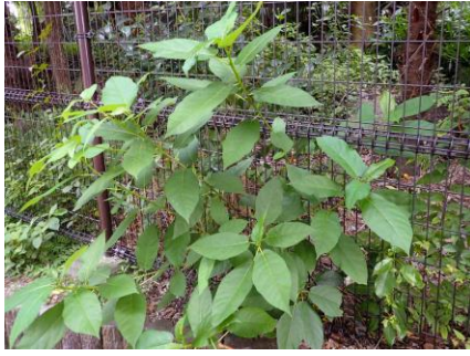
イヌビワ 210718