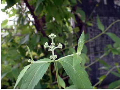
ヒョドリバナ属 210718