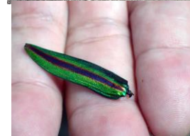
枯木にヤマトタマムシが来ていた 210718