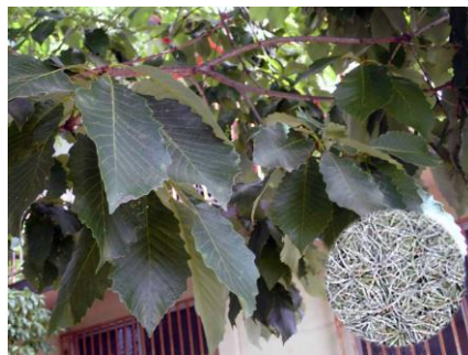
ナラガシワ 210718