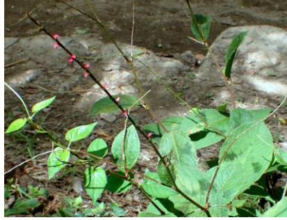
ミズヒキ 210718