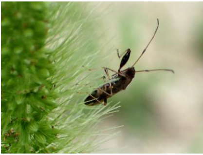
ヒゲナガカメムシ 210718