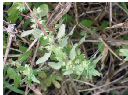
オオヒカゲミズ：線路に沿って拡大 210718