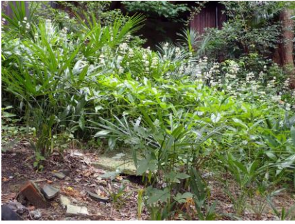
ヤブミョウガが群生し、花盛り 210718