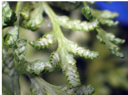
カニコサ胞子葉 210718