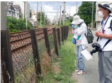
阪堺線沿いの野草の種類には特徴がある 210718