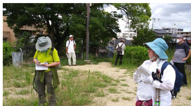
北畠西公園での調査風景 210718