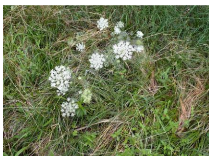
ノラニンジン 210718

ノゲシ 2 ノラニンジン 2 ハタケニラ 2 ヒナタイノコズチ 1 ヘクソカズラ 1 マテバシイ●1 マメグンバイナズナ 3 マルバツユクサ 1 ムラサキカタバミ 2