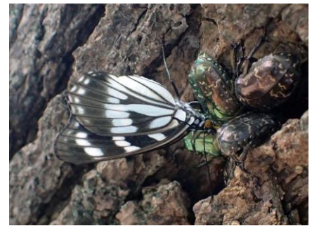
ゴマダラチョウも酒場に来た 210718