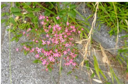
ハナハマセンブリ 210718