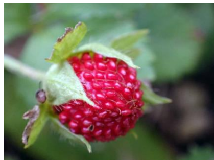
ヤブヘビイチゴ：粒状の果実(そう果)は つるんとしていて、果床も赤く光沢がある 210718