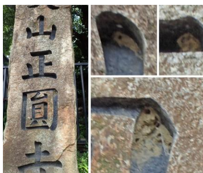
キボシツクリバチの巣あと 210718 撮影 柗元慶子