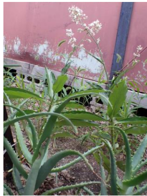
ヤブミョウガ 210718