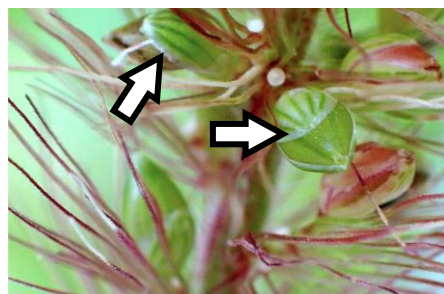
アキノエノコログサ：第2苞穎が短い 210718