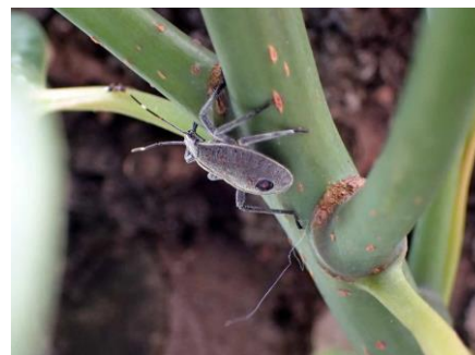
キマダラカメムシの幼虫 210718