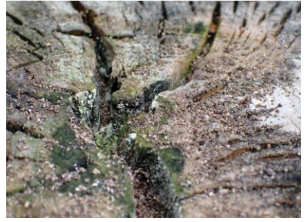
オオハリアリ 210718