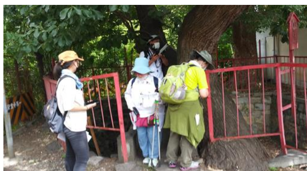
正圓寺弁天池ナラガシワ 210718