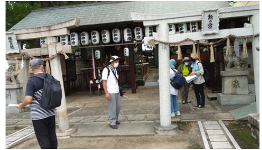
阿部野神社での調査風景 210718