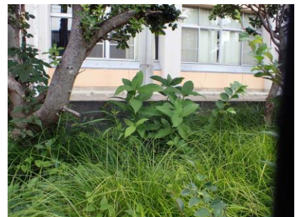
イヌビワ：上町台地の古い樹木のある 場所の日蔭に多く出る 210718