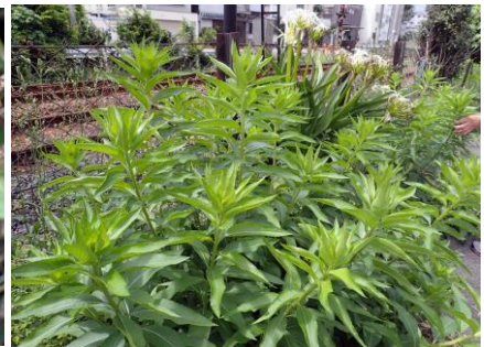
アレチマツヨイグサ：花はまだ 210718