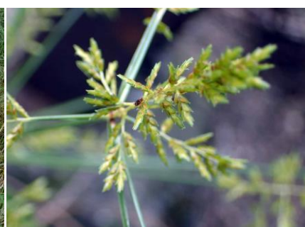
カヤツリグサ 210718