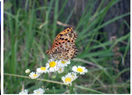
ヒメジョオンに吸蜜にきたツマグロヒョウモン 210718