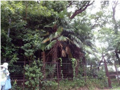
実生のシュロが鬱蒼と茂っていた 210718