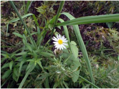
ヨメナ 210718