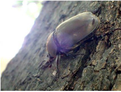
カブトムシ♀も酒場に来た 210718