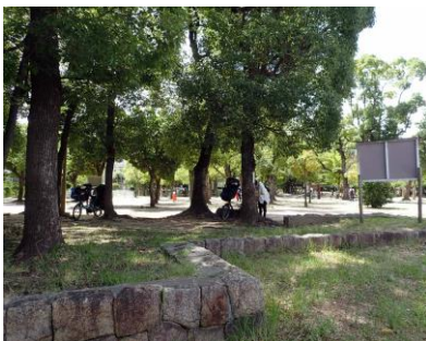
北畠（晴明丘）中央公園は 高木が多く、緑陰が確保されていた 210718

シロツメクサ 1,2 スズメノカタビラ 2,3 センダン 4 ソテツ●1 タンポポ sp.1 チチミザサ 1 ツメクサ sp.3 ツユクサ 1 トウジュロ 4 トウネズミモチ●3 トキワハゼ 2 ドクダミ 1 ナギナタガヤ 3 ノキシノブ 1 ハナツクバネウツギ●2 ヒナタイノコズチ 1 ヒメムカシヨモギ 1 ヒラドツツジ●1 ヘクソカズラ 1 ホソムギ 2 ホルトノキ●2 マテバシイ●1 マメグンバイナズナ 3 ミズヒキ 2 ムクノキ 4 ムラサキカタバミ 1 ヤブガラシ 1,2 ヤブヘビイチゴ 3 ヤマモモ●1 ヨモギ 1 外来タンポポの一種 2,3