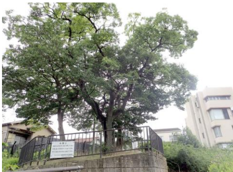
北畠西公園：上町台地の崖にある公園 大きなエノキが目印 210718 撮影 柗元慶子

シマスズメノヒエ 2,3 シャリンバイ●3 シュロ 4 シロツメクサ 2 チガヤ 1 ドクダミ 3 ナギナタガヤ 3 ナンテン 4 ノゲシ 2 ハナハマセンブリ 2 ヒナタイノコズチ 1 ヒメジョオン 2 ヒメムカシヨモギ 1 フランスギク●2 ヘクソカズラ 2 マメグンバイナズナ 3 ムラサキカタバミ 2 ヤブガラシ 2 ヨメナ 2 ヨモギ 1 外来タンポポの一種 2