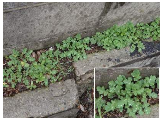
ナガミヒナゲシのロゼット群 190317