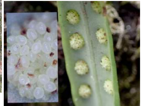
ノキシノブの葉の裏の先の方にある孢子囊 190317