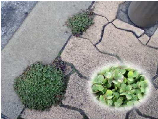
隙間にびっしりのカタバミ 190317