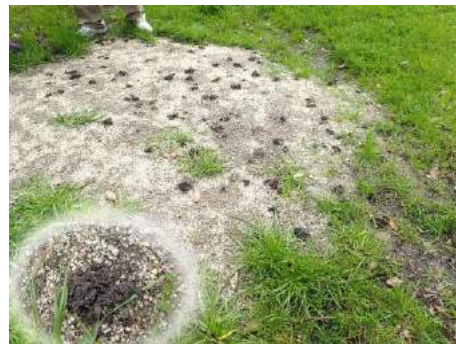
おそらく倒木の抜根跡。目立つのはミミズのふん。 190317