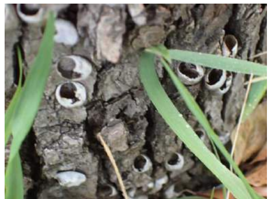
ヒロヘリアオイラガの羽化殻(繭の殻) 190317