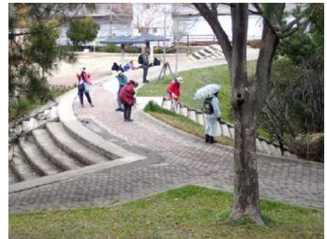
雨が降ったりやんだり、傘や雨合羽で調査 190317