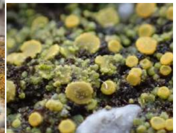
ツブダイダイゴケは濡れると 緑色になる 190317