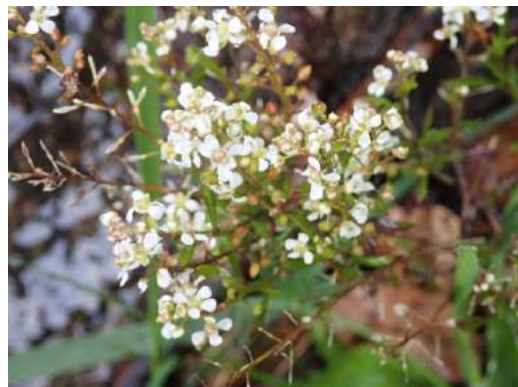
マメグンバイナズナ 190317