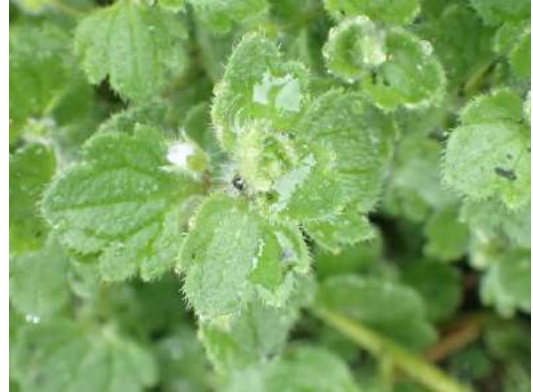
フラサバソウは毛が多い 190317