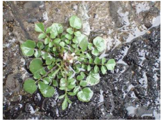
ミチタネツケバナ 190317