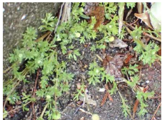
マメカミツレ 190317