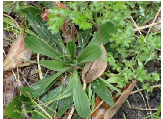
ヘラオオバコ 190317