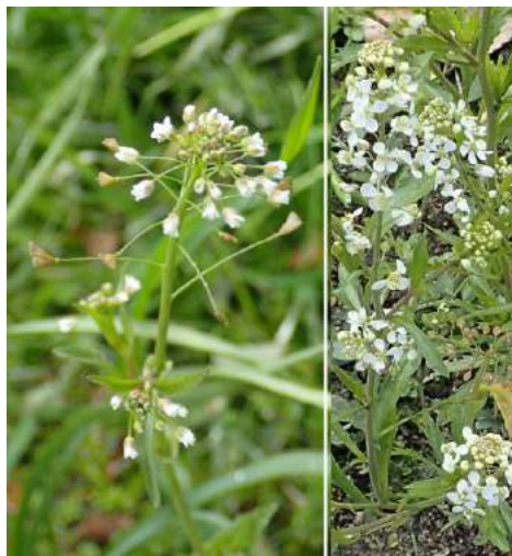
左ナズナ、右マメゲンバイナズナ 近い場所にそれぞれ咲いていた 190317