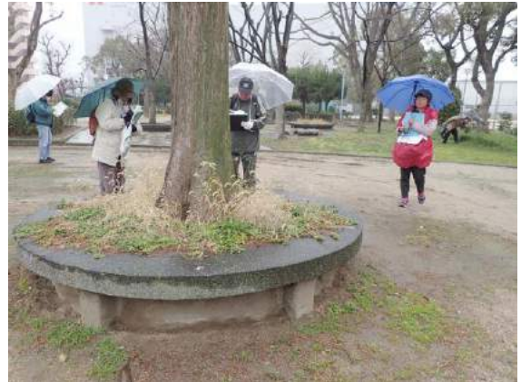
桜島公園での調査風景：雨に濡れながら記録 190317