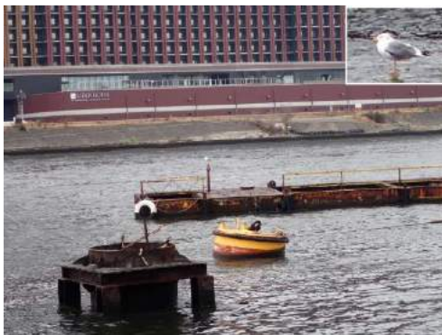
セグロカモメ 190317