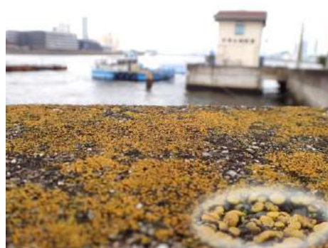
ツブダイダイゴケは潮風にも強いのか 190317