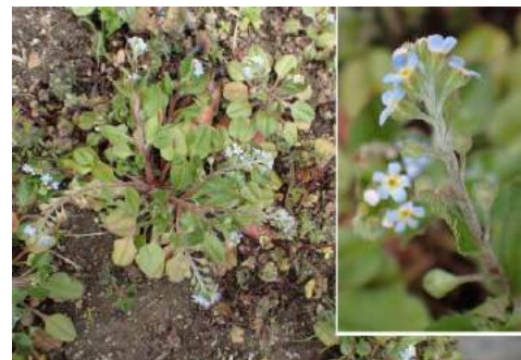
日中友好の碑の前にはキュウリグサ群 190317