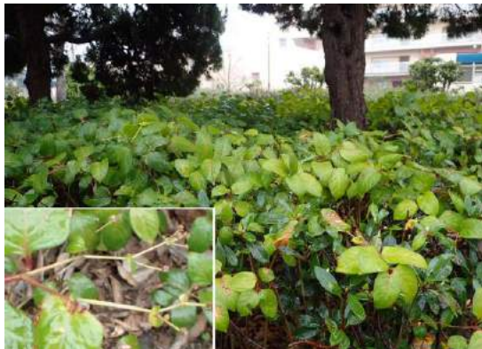
ツルソバ 190317

アカネ科…ヤエムグラ 1 アブラナ科…マメグンバイナズナ 2 キク科…アキノノゲシ 1、セイタカアワダチソウ 1、 タンポポ sp.1、ヨモギ 1 シソ科…ホトケノザ 2 タデ科…ツルソバ 2,3 ツバキ科…ヤブツバキ 2(植) バラ科…カンヒザクラ 2(植) フウロソウ科…アメリカフウロ 1 マメ科…カラスノエンドウ 2、スズメノエンドウ 1