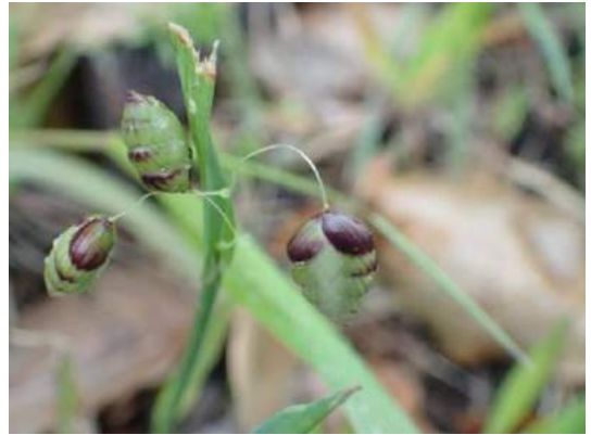
コバンソウ 190317