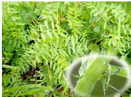
スズメノエンドウ 托葉が裂けた形 190317

アカバナ科…コマツヨイグサ 1 イネ科…スズメノカタビラ 2 キク科…メリケントキンソウ 1 ケシ科…ナガミヒナゲシ 1 シソ科…ホトケノザ 2 スイカズラ科…ハナツクバネウツギ 1(植) ツバキ科…ヤブツバキ 2(植) ナデシコ科…シロバナマンテマ 1 マメ科…カラスノエンドウ 2、スズメノエンドウ 1 レンブクソウ科…サンゴジュ 1(植) 動物…サンゴジュハムシ 0 食痕、 ソラマメヒゲナガアブラムシ 2,4、ハラビロカマキリ 1