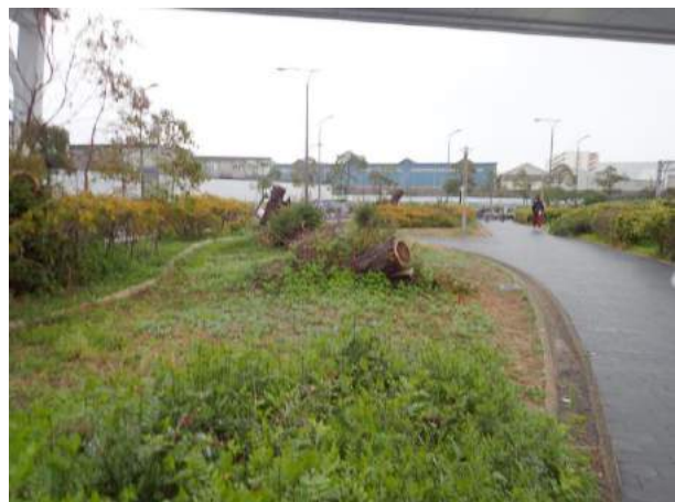
桜島駅前にはさまざまな小さな花が咲いていたが大きな樹木が倒れて、枝がはらわれていた。