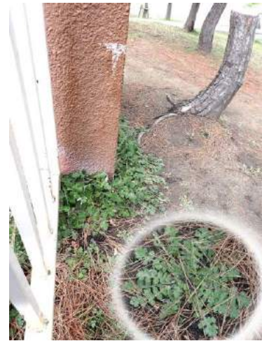
ワタゲハナグルマは植栽から逃げたのか 190317 撮影 榎元慶子

アカネ科…ヤエムグラ 1 アブラナ科…カラクサナズナ 2、セイヨウカラシナ 1、 ナズナ 2,3、マメゲンバイナズナ 2 イチョウ科…イチョウ 0 落葉(植、上部がない) イネ科…スズメノカタビラ 2、ネズミムギ 2 ウラボシ科…ノキシノブ 2 オオバコ科…フラサバソウ 2 カタバミ科…オオキバナカタバミ 1、フヨウカタバミ 2(植) キキョウ科…キキョウソウ 1 キク科…アレチノギク 2、ウラジロチチコグサ 1、オニタビラコ 1,2、セイヨウタンポポ 2、チチコグサ 1、 チチコグサモドキ 1,2、ノースポール 2(植)、ノボロギク 1、マメカミツレ 2、ヨモギ 1、 ワタゲハナグルマ 1(植) キジカクシ科…ハラン 1(植) クスノキ科…クスノキ 1(植) シソ科…ホトケノザ 2 ナデシコ科…オランダミミナグサ 1、コハコベ 2、 シロバナマンテマ 2 フウロソウ科…アメリカフウロ 1 バラ科…ウメ 2(植) ヒガンバナ科…ハナニラ 2、ヒガンバナ 1 マメ科…カラスノエンドウ 1、コムツブツメクサ 1、シロツメクサ 1 ムラサキ科…キュウリグサ 1 モクマオウ科…モクマオウ 1(植) ヤシ科…カナリーヤシ 1(植) 動物…イラガ 0 羽化後繭、 クスベニヒラタカスミカメ 0 食痕、 ホソヒラタアブ 4、ミズノ一種 0 糞、 モモアカアブラムシ 2,4、ワタアブラムシ 2,4