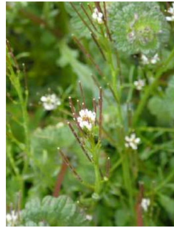
ミチタネツケバナ 190317