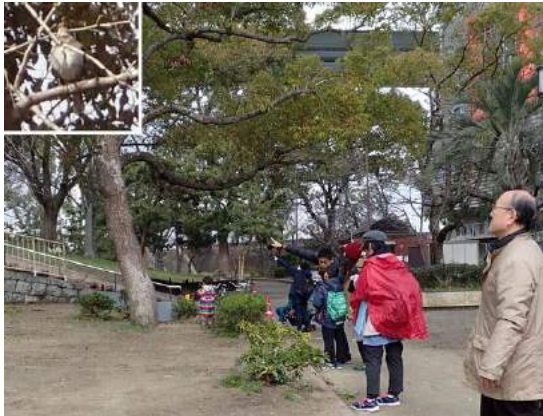
みんなの指さす先に、ツグミ 190317