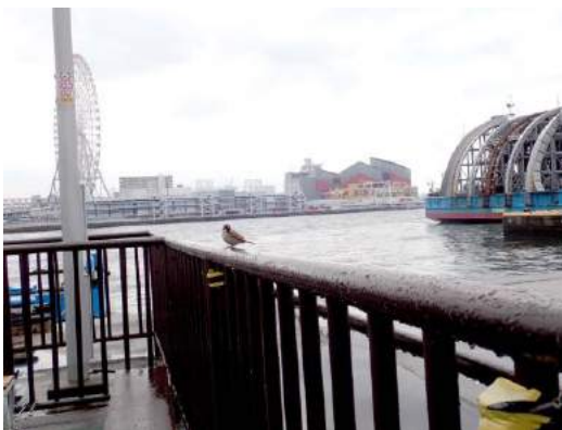
渡船場でスズメが近寄ってきた 190317