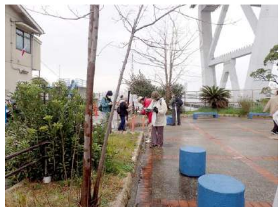
天保山公園での調査風景 190317