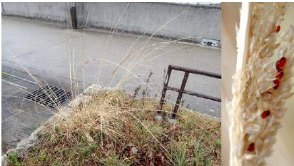
ネズミノオと呼ぶには大きい穂が残っていた 190317

動物…オオバン 4、カルガモ 4、カワラヒワ 0 声、コガモ 4、スズメ 4、セグロカモメ 4、ドバト 4、ハクセキレイ 0 声、アブラバチの一種 4、オカダンゴムシ 2,4、クロゴキブリ 2、サビヒョウタンナガカメムシ 4、トビイロシワアリ 4、ヒロヘリアオイラガ 0 羽化後繭