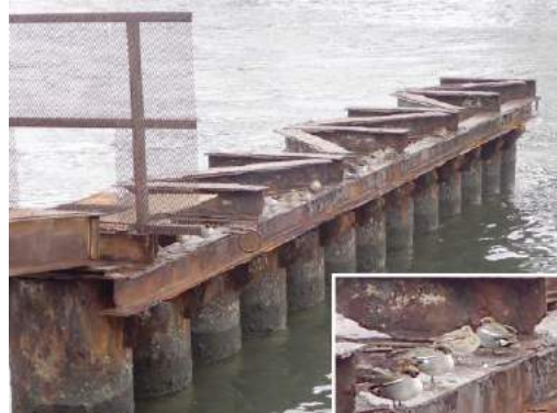
コガモが並んでいた 190317