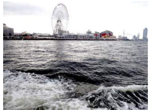
渡船に乗ると、風が強く波が荒かった 190317