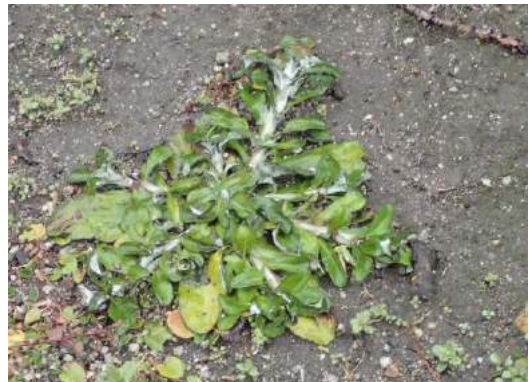
ウラジロチチコグサ 190317