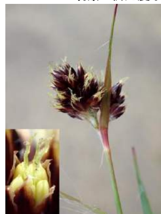
スズメノヤリ 190317