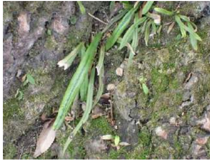
ノキシノブ 190317