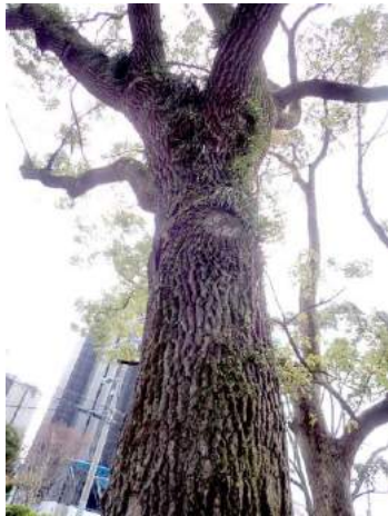
ノキシノブがびっしりついていた クスノキ 190317