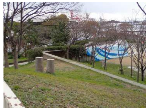
台風による倒木は多数あったと思われる 190317