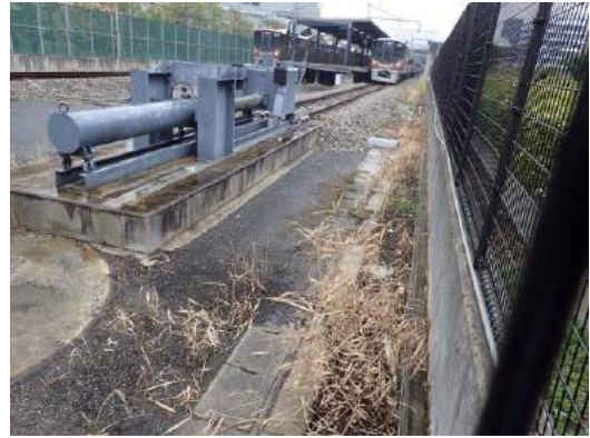
桜島駅終点に生えるヨシ 190317 撮影 榎元慶子

アカネ科…クチナシ 1(植,街路樹) アカバナ科…コマツヨイグサ 1 アブラナ科…カラクサナズナ 1 イネ科…コバンソウ 2、ヨシ 1 オオバコ科…ヘラオオバコ 1 キク科…ウラジロチチコグサ 1、ヨモギ 1 キョウチクトウ科…キョウチクトウ 1(植) クスノキ科…クスノキ 1(植,街路樹) グミ科…ナワシログミ 4 セリ科…ノチドメ 1 ツツジ科…ヒラドツツジ 1(植) ツバキ科…カンツバキ 2(植) トクサ科…スギナ 2(ツクシ) ナデシコ科…シロバナマンテマ 1 ニレ科…アキニレ 4 バラ科…シャリンバイ 1(植)、トキワサンザシ 4 ヒノキ科…カイヅカイブキ 1(植) ブナ科…スダジイ 1(植) マツ科…クロマツ 1(植) モクセイ科…トウネズミモチ 4 マメ科…カスマグサ 2 ヤマモモ科…ヤマモモ 2(植) 動物…ヒヨドリ 0 声,4、クスベニヒラタカスミカメ 0 食痕、 ヒロヘリアオイラガ 0 羽化後繭、ミカンワタカイガラムシ 2、 マエアカスカシノメイガ 4