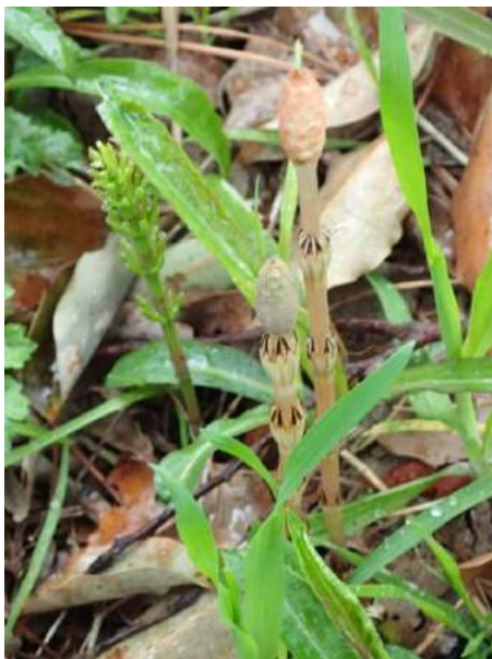
スギナ(ツクシ) 190317