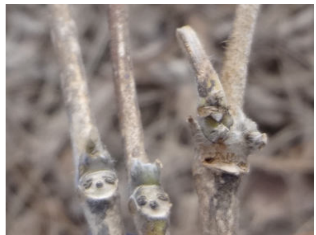
クズの葉痕 150118