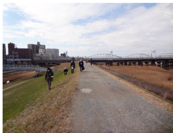
堤防の斜面に生える草は限られた種類しかなく へばりつくように生えています 150118