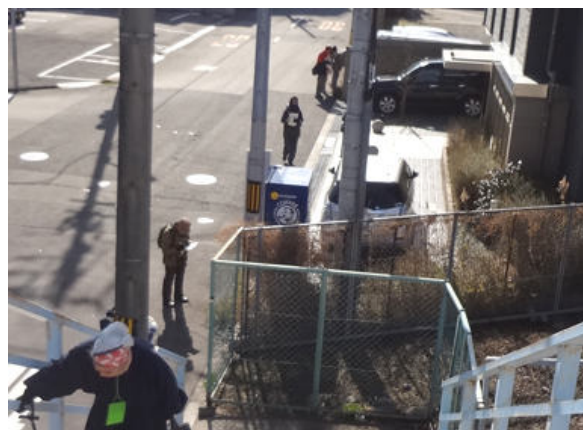
寄り道多く、堤防にはなかなかたどり着けません 150118 撮影:北川ちえこ

イネ科…チガヤ 1 オオバコ科…ヘラオオバコ 1 キク科…ヨモギ 1 シソ科…ホトケノザ 1 ナデシコ科…オランダミミナグサ 1 ユリ科…ノビル 1 動物…アオサギ 4、オオバン 4、カイツブリ 4、カワウ 4、 キンクロハジロ 4、ジョウビタキ 4、スズガモ 4(雄雌)、 スズメ 4、セグロセキレイ 4、ハクセキレイ 4、 ホオジロ 4、ホシハジロ 4