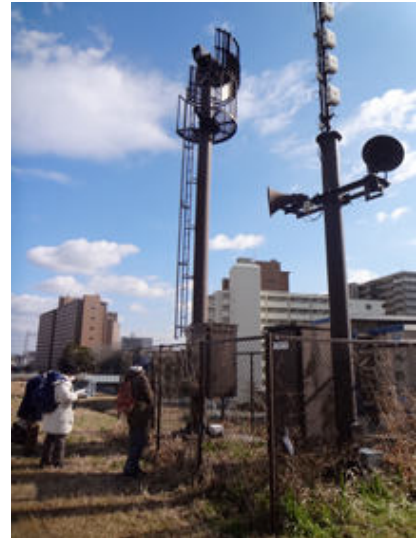
堤防には増水など危険を知らせる「河川情報提供設備」が看板と共に設置して有りました。フェンスで囲って有る中は草刈りが及ばず、木の实生や数種の草本が見られました。