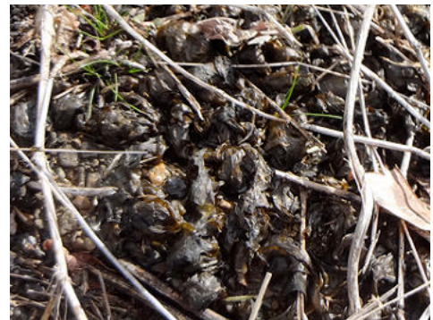
イシクラゲ:キクラゲのように見えますが藍藻の仲間で食べられるそうですが、見かけ上は食欲をそそりません。150118