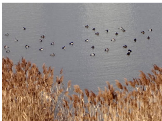
淀川には色々な水鳥がいました 150118