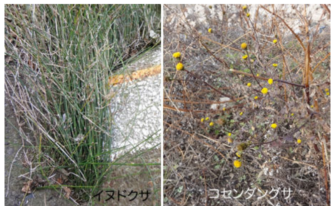
JR の電車が走る下のところにはイヌドクサと枯れた蔓植物が 沢山生えていました。その中でコセンダングサの黄色い花が 映えていました。 150118