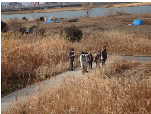
河川敷 150118

キク科…ウラジロチチコグサ 1、ノゲシ 2 シソ科…ヒメオドリコソウ 1、ホトケノザ 1 ナス科…イヌホオズキ 3 ナデシコ科…オランダミミナグサ 1 ムラサキ科…キュウリグサ 1 動物…ヒヨドリ 4、ハクセキレイ 4、ヒゲブトハムシダマシ 4