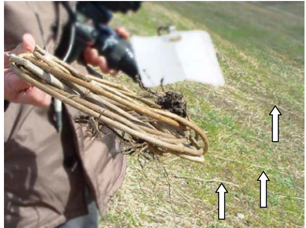
斜面のクズの茎(矢印)を巻き取ると、リース材料に！ 150118

アブラナ科…イヌガラシ 3、ナズナ 2 イネ科…スズメノカタビラ 2、セイバンモロコシ 3、ヌカキビ 1(立枯れ) オオバコ科…ヘラオオバコ 1 カヤツリグサ科…ミコシガヤ 3、メリケンガヤツリ 3 キク科…アキノゲシ 1(立枯れ)、セイヨウタンポポ 3、マメカミツレ 1 キンポウゲ科…キツネノボタン 1 クマツヅラ科…アレチハナガサ 2