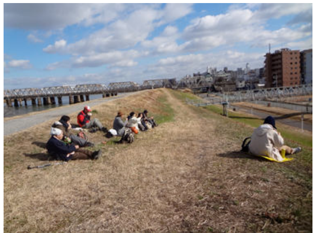
風も無く、暖かい日財の中でお昼をとりました。 150118