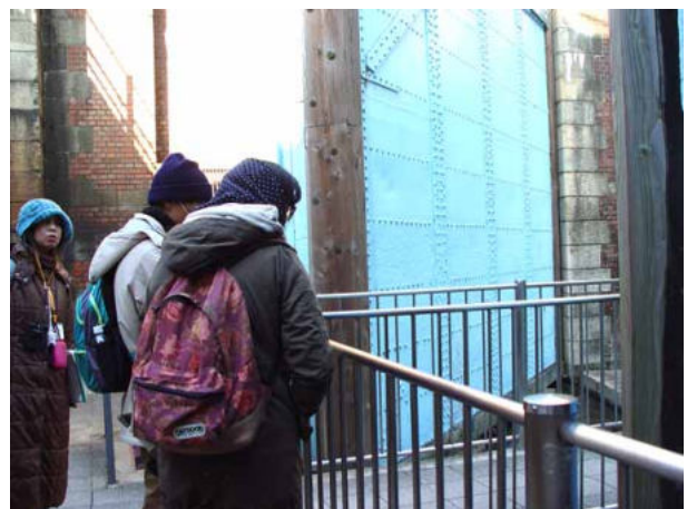
毛馬旧閘門で水面を見る 150118