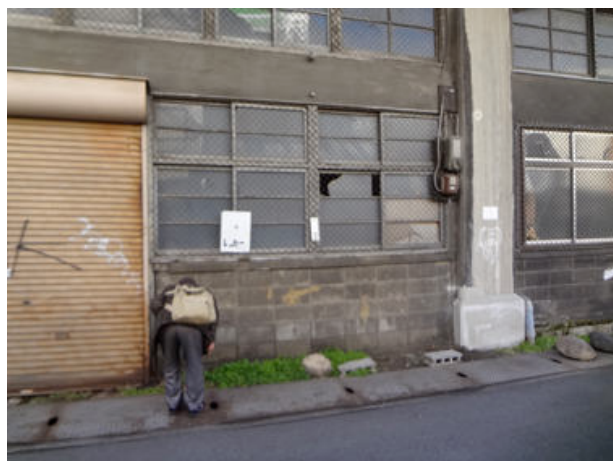
緑少ない街中では草を見れば小さな一角でも調査の対象です。150118

イネ科…エノコログサ 1(立枯れ)、チガヤ 1 カタバミ科…オッタチカタバミ 1、ノボロギク 1、 ムラサキカタバミ 1 キク科…ウラジロチチコグサ 1、オニタビラコ 2、 ノゲシ 1、ヨモギ 1 シソ科…ホトケノザ 1 ツバキ科…ツバキ 2(植) ナス科…イヌホオズキ 2 ナデシコ科…コハコベ 1、ミドリハコベ 1 バショウ科…バナナ 3(植) ムラサキ科…キュウリグサ