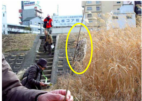
フタモンアシナガバチの巣 150118

シソ科…ホトケノザ 1 センダン科…センダン 4 タデ花…ナガバギシギシ 1,3 ナデシコ科…オランダミミナグサ 1、コハコベ 1 マメ科…シロツメクサ 1、ヤブマメ? 3(立枯れ) 動物…カンムリカイツブリ 4、カワウ 4、 キンクロハジロ 4、ツグミ 4、ヒヨドリ 4、ホオジロ 4、 ホシハジロ 4、ムクドリ 4、 チョウセンカマキリ 0 卵鞘(センダンに)、 ヒロヘリアオイラガ 2 前蛹(繭)、 フタモンアシナガバチ 0 巣